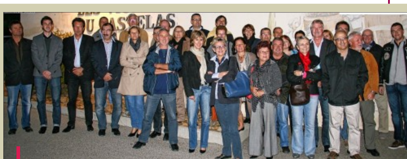
Elus, parrains, partenaire et bénévoles s'impliquent activement dans l'organisation de cette course sportive, conviviale et solidaire.

Après un an d'interruption, la boucle rochefortaise est au calendrier des courses gardoises hors stade. Un rendez-vous sportif, convivial et solidaire qui rassemble aujourd'hui des centaines de coureurs, un large public et de nombreux partenaires.